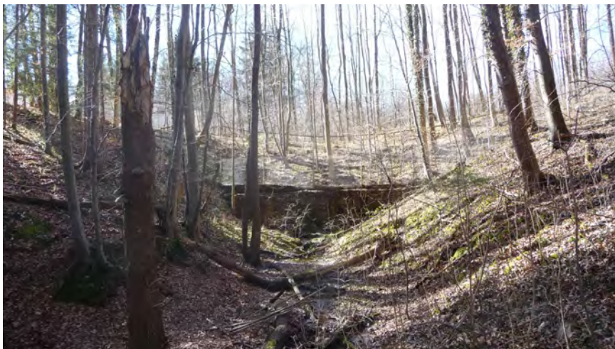
Abb. 6: Im Hintergrund zur Rodung geplanter Bereich über der "Quelle" aus Abb. 5