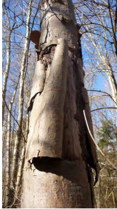
Abb. 3: mögliches Fledermaus-Spaltenquartier