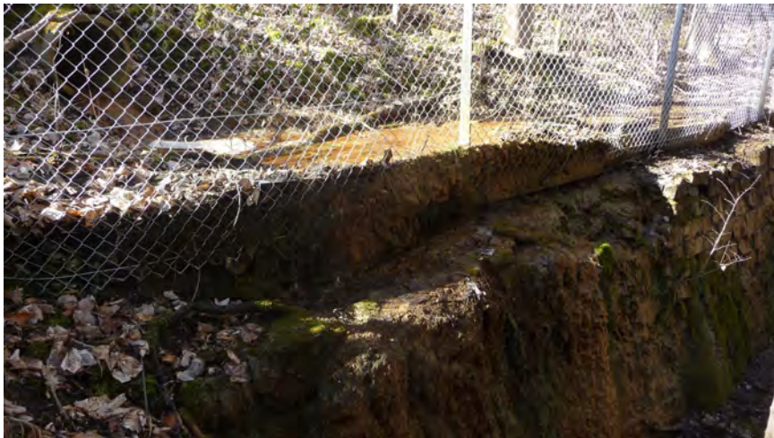
Abb. 5: Deutliche Sinterbildung am größten "Quell"-Bach