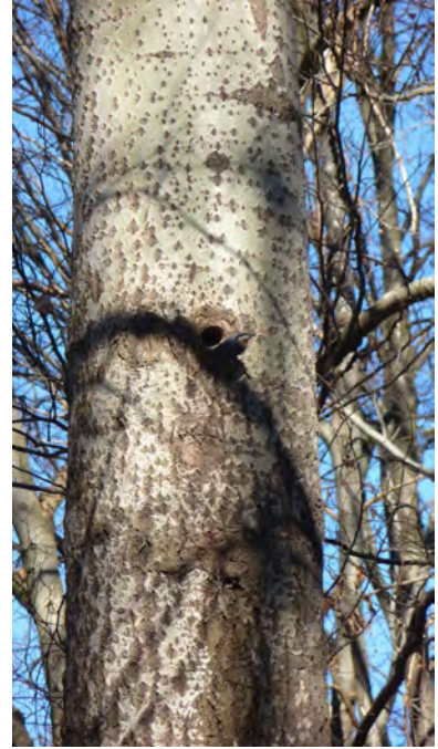
Abb. 4: Kleiber an alter Spechthöhle