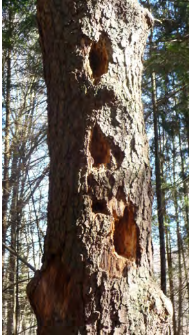
Abb. 2: Spechtaktivität