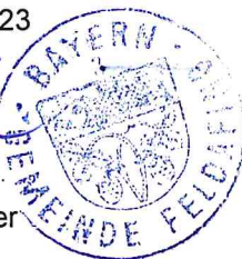
Bernhard Sontheim Erster Bürgermeister